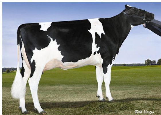
MORNINGVIEW SUPER DEANN Dam